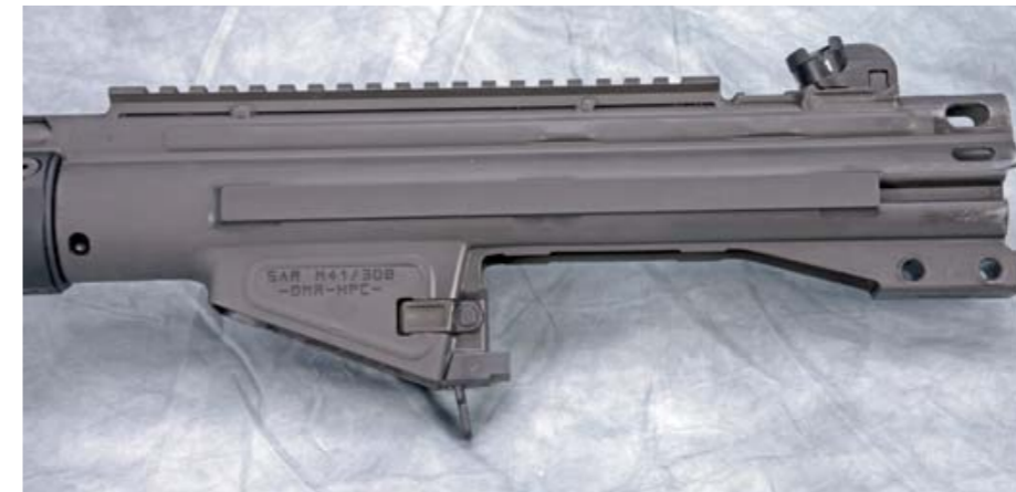
Das Systemgehäuse von beiden Seiten: Rechte Seite mit hinter dem Auswurfenster angeschweißtem Hülsenabweisschild, linke Seite mit aufgeschweißter Schiene zur Erhöhung der Verwindungssteifigkeit.

1.264 Gramm (!) bei wiederholgenauer, glasklarer Charakteristik. Abzugsfehler gehören mit diesem Matchabzug, der auch für schnelle Serien bestens geeignet ist, der Vergangenheit an – mehr geht nicht. Von daher muss man den Preis von 348 Euro wohl als durchaus gerechtfertigt ansehen.