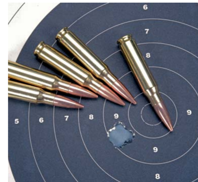
Diese auf 100 Meter realisierte Fünf-Schuss-Gruppe mit Hornady 168 Grains Match Munition misst nur 12 mm und macht deutlich, dass sauber gefertigte Selbstladegewehre den Vergleich mit vielen Zylinderverschlussbüchsen nicht scheuen müssen.

ren Schusserien, wie sie in dynamischeren Sportdisziplinen vorkommen, ein akkurateres Treffen. Ein Großteil des Abzugsgewichtes kann bereits im Vorzugsweg überwunden werden, so dass für die eigentliche Schussauslösung nur noch ein paar Gramm übrig bleiben. Angesichts der sauberen Verarbeitung, Ausstattung, Funktion und Schussleistung gehen die verlangten 2.880 Euro für das halbautomatische Präzisionsgewehr SAR M41 DMR HPC im Standardkaliber .308 Winchester – das den Titel „Schwäbische Schießmaschine“ zu Recht trägt – voll in Ordnung.