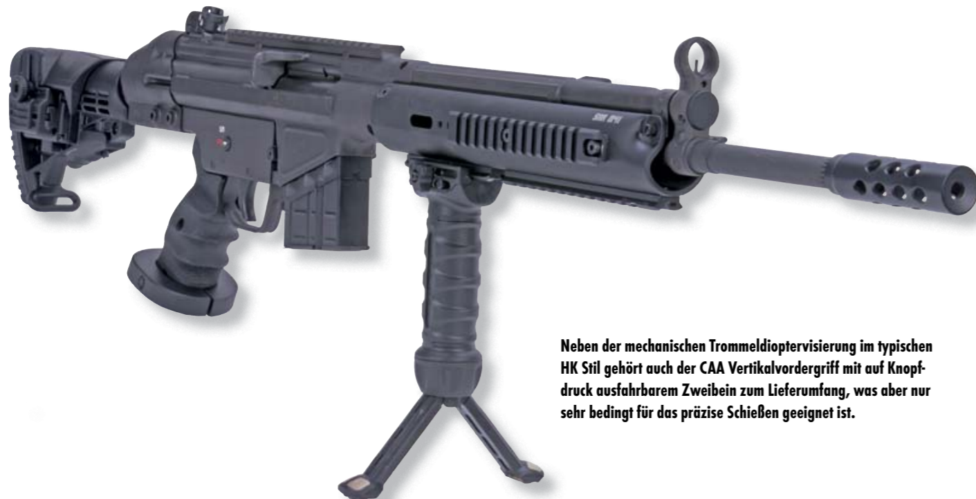
Neben der mechanischen Trommeldioptervisierung im typischen HK Stil gehört auch der CAA Vertikalvordergriff mit auf Knopfdruck ausfahrbarem Zweibein zum Lieferumfang, was aber nur sehr bedingt für das präzise Schießen geeignet ist.

die Hornady 168 Grains Zombie Z-Max. Enttäuschend und weit abgeschlagen war das Präzisionsresultat von 84 mm mit der PMC 147 Grains FMJ, dennoch reichte es in der durchschnittlichen Schussleistung für 37,1 mm. Der Schießkomfort des 6,1 kg schweren Präzisionsgewehrs bewegt sich aufgrund der verstellbaren Schulterstütze mit Wangenauflage, Pistolengriff mit Handkantenauflage, Matchabzug feinsten Qualität und HPC Kompensator definitiv in den höchsten Regionen. Vor allem der Abzug mit sauberer Charakteristik und sehr gleichmäßigem, wiederholgenauem Abzugsweg erlaubt selbst bei schnelle-