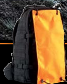
TT OBSERVER PACK