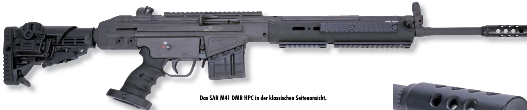
Das SAR M41 DMR HPC in der klassischen Seitenansicht.