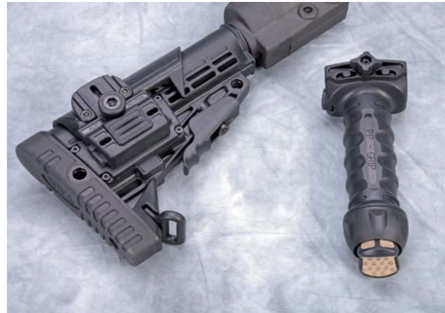
Die vielseitig verstellbare Schulterstütze besteht hauptsächlich aus widerstandsfähigem Polymerkunststoff.

Im Rahmen der Erprobungen tauschten wir die von SAR schon überarbeitete Standardabzugsgruppe des M41 DMR gegen die brandneue Matchabzugseinheit aus dem Hause aus Rottweil aus. Ehrgeiziges Ziel dieser sehr sauber verarbeiteten Eigenentwicklung mit Komponenten aus besten